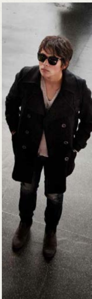
MIELE Valeria Golino (Włochy, Francja)