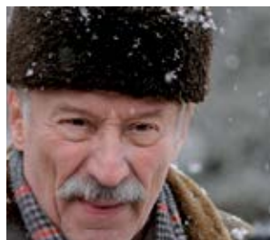
Medalia de onoare Calin Peter Netzer (Rumunia, Niemcy)