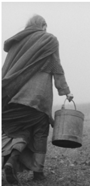
A Torinói ló Béla Tarr (Węgry, Francja, Szwajcaria, Niemcy)