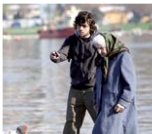
Pandora'nin kutusu Yesim Ustaoglu (Turcja, Francja, Niemcy, Belgia)