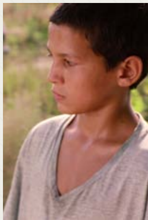
Csak a szél Bence Fliegauf (Węgry, Niemcy, Francja)