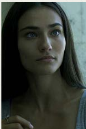
Eastern Plays Kamen Kalev (Bułgaria, Szwecja)