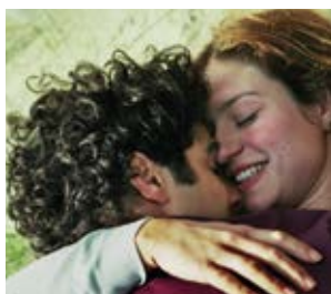
À perdre la raison Joachim Lafosse (Belgia, Francja, Luksemburg, Szwajcaria)