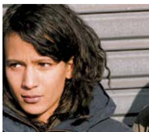
35 Rhums Claire Denis (Francja, Niemcy)