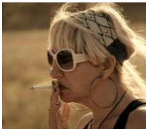
La Plaga Neus Ballús (Hiszpania)