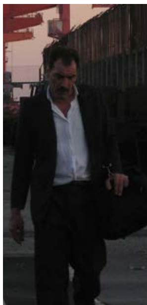
La Bocca del Lupo Pietro Marcello (Włochy)