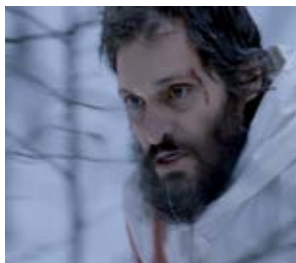
Essential Killing Jerzy Skolimowski (Polska, Norwegia, Irlandia, Węgry)