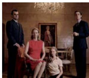
Io sono l'Amore Luca Guadagnino (Włochy)