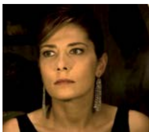
Il resto della notte Francesco Munzi (Włochy)