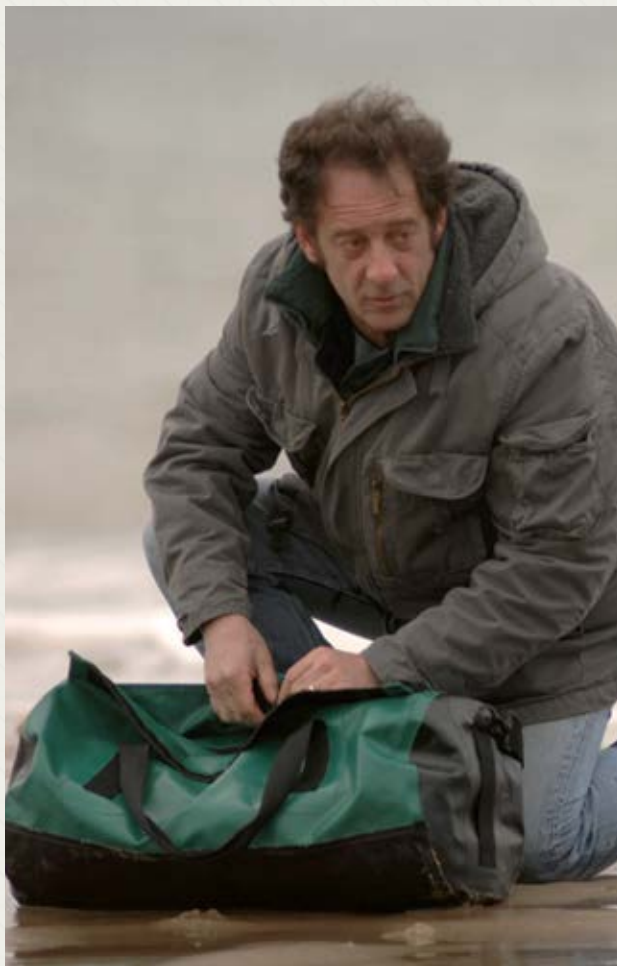
Welcome Philippe Lioret (Francja)