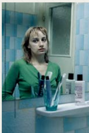
4 Luni, 3 Saptamini Si 2 Zile Cristian Mungiu (Rumunia)