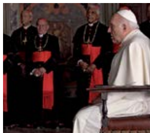
Habemus Papam Nanni Moretti (Włochy, Francja)