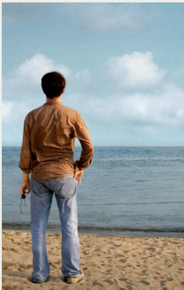
Auf der anderen Seite Fatih Akin (Niemcy, Turcja)