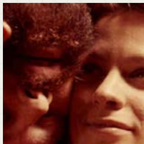
W KRĘGU MIŁOŚCI Felix van Groeningen Belgia (2012)