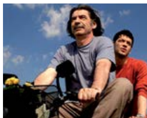
Svetat E Golyam I Spasenie Debne Otvsyakade Stephan Komanda (Bułgaria, Niemcy, Węgry, Słowenia)