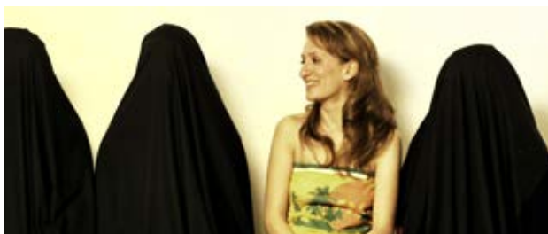
Exile Family Movie Arash T. Riahi (Austria)