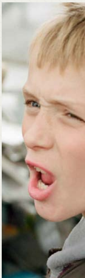
OLBRZYM – SAMOLUB Clio Barnard (Wielka Brytania)