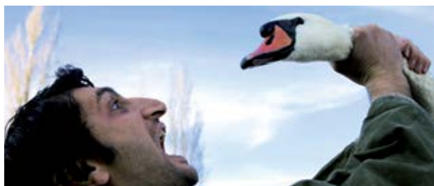
Ein Augenblick Freiheit Arash T. Riahi (Austria, Francja)