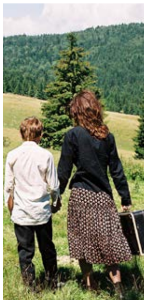
Katalin Varga Peter Strickland (Rumunia, Wielka Brytania, Węgry)