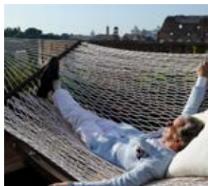
La Grande Bellezza Paolo Sorrentino (Włochy, Francja)