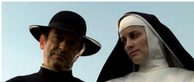
Misterios de Lisboa Raúl Ruiz (Portugalia)