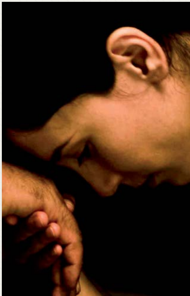
Die Fremde Feo Aladag (Niemcy)