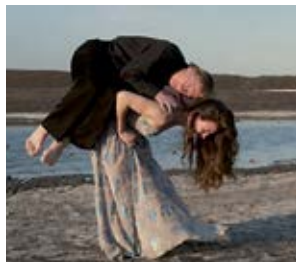
Pina Wim Wenders (Niemcy, Francja, Wielka Brytania)