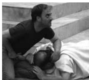
Cesare deve morire Paolo i Vittorio Taviani (Włochy)