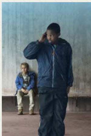
Play Ruben Östlund (Szwecja, Francja, Dania)