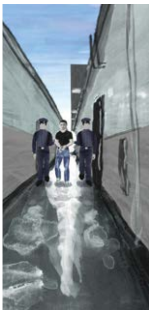
Crulic – drumul spre dincolo Anca Damian (Rumunia, Polska)