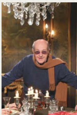
Belle Toujours Manoel de Oliveira (Francja, Portugalia)