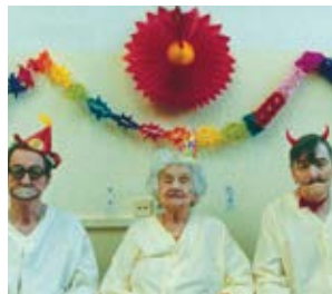
Import/Export Ulrich Seidl (Austria)