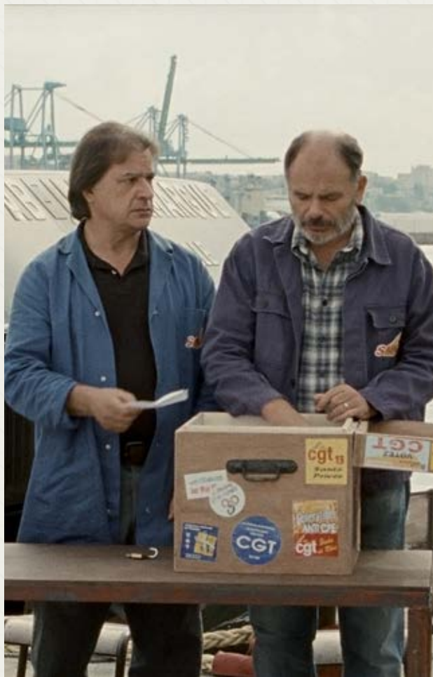
Les Neiges du Kilimandjaro Robert Guédiguian (Francja)