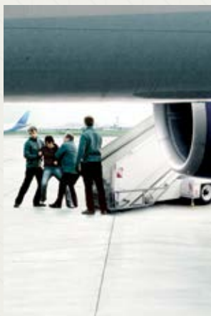
Illégal Olivier Masset-Depasse (Belgia, Francja, Luksemburg)