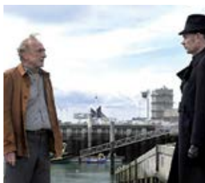
Le Havre Aki Kaurismäki (Finlandia, Francja, Niemcy)