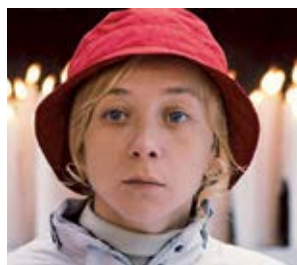
Lourdes Jessica Hausner (Austria, Francja, Niemcy)