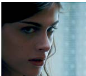
Indigène d'Eurasie Sharunas Bartas (Francja, Litwa, Federacja Rosyjska)