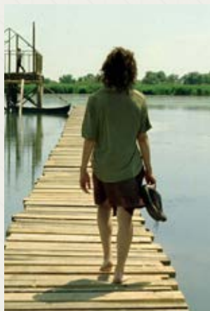
Delta Kornél Mundruczó (Węgry, Niemcy)